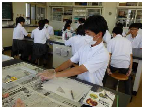
きれいにしていきます