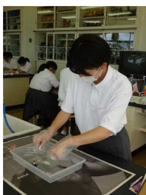
眼球を切断しています