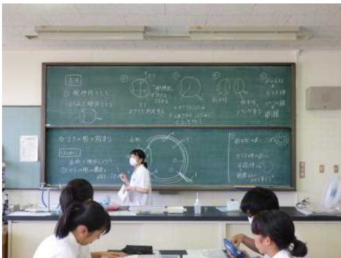
はじめに今日の実験の説明

生物生産科1年の「科学と人間生活」の生物分野では、「ヒトの眼の構造」を学習しています。ヒトの眼の構造は、同じ哺乳類である ブタの眼の構造 とほぼ同じであることが知られています。そこで今日は2人に1個ブタの眼球を配り、解剖することにより眼の構造を確認しました。初めはこわごわでしたが、次第に大胆に。眼の構造が理解できたかな。