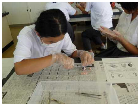
付着している筋肉などを取り除き