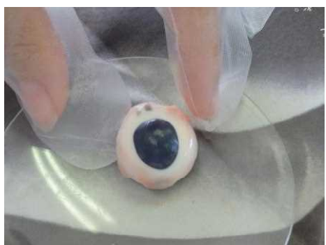
きれいになりました