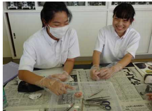
おそろおそろ ツンツン