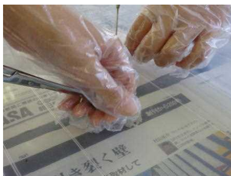
眼の強膜は結構硬くて切れない