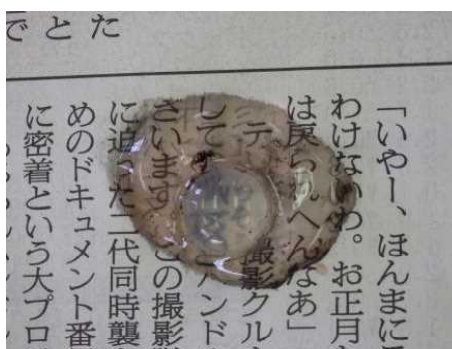
水晶体はレンズだと実感！