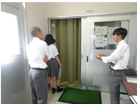
7月7日：校内鑑定競技大会（B科）

収穫祭に向け、サツマイモを栽培し ます。定植後は、鑑定競技県大会の レクリエーションを相談しました。