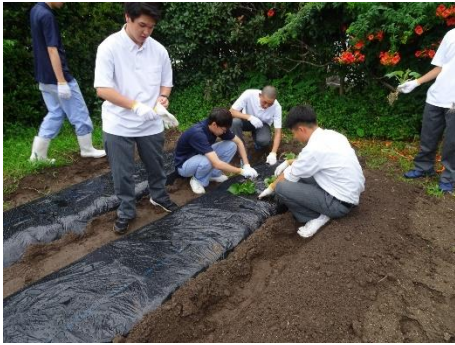
6月30日：サツマイモ・スイカ定植／鑑定レクリエーション打ち合わせ

GWに出された課題から、各クラス代表が自分の 思い・考えを全校の前で発表します。 運営を務めました。