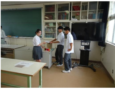
7月27日：鑑定競技準備