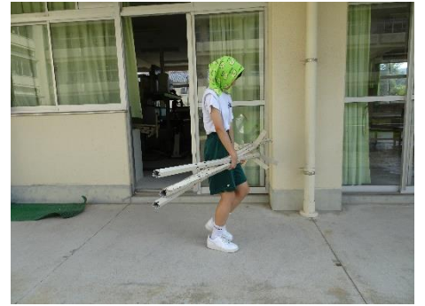
7月28日：鑑定競技県大会